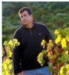
Côtes du Roussillon Modeste 2022 Domaine du Clos des Fées