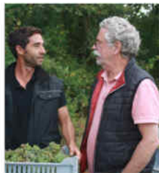
Bourgueil Mi-Pente 2020 Domaine de la Butte