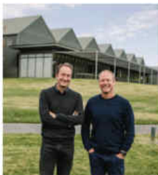
Shaw and Smith M3 Chardonnay 2021 Shaw and Smith